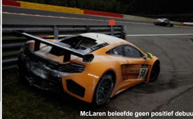
McLaren beleefde geen positief debuut