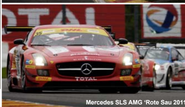
Mercedes SLS AMG 'Rote Sau 2011'