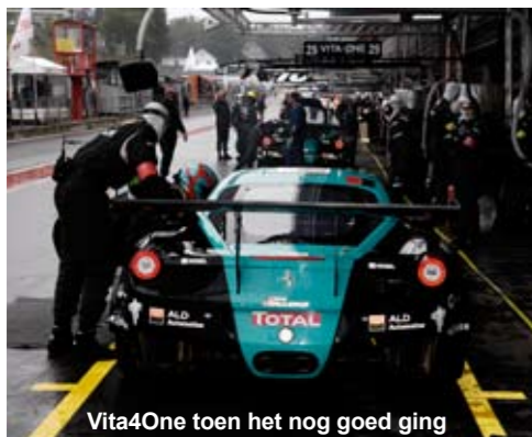
Vita4One toen het nog goed ging

Spa is dit jaar onderdeel van de Blancpain Endurance Series en strikt voorbehouden aan GT3 en GT 4 auto's. Daarmee lijkt de toekomst van de Total 24 Uren van Spa voorlopig gered te zijn. Waar afgelopen jaar nog een speciale, mager gevulde European GT2 cup in het leven geroepen moest worden om het evenement met hangen en wurgen op de kaart te houden, vormt de Blancpain Endurance een verademing. Meer dan 60 auto's staan aan de start op zaterdag 30 juli, waaronder een indrukwekkend aantal Audi's R8 LMS.