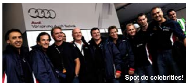
Spot de celebrities!

De oude wijsheid "Win on Sunday, sell on Monday" gaat dus nog steeds op. We zijn eigenlijk best benieuwd hoeveel klanten er bij de Belgische dealers op de stoep stonden na de winst op Spa. ○